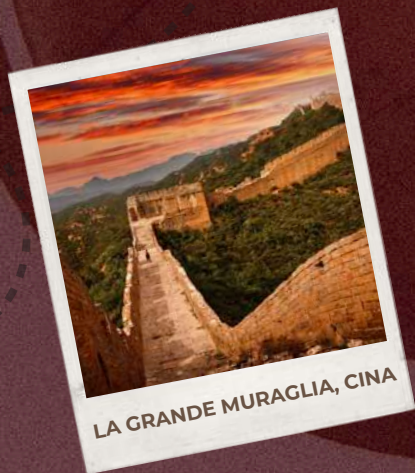
LA GRANDE MURAGLIA, CINA